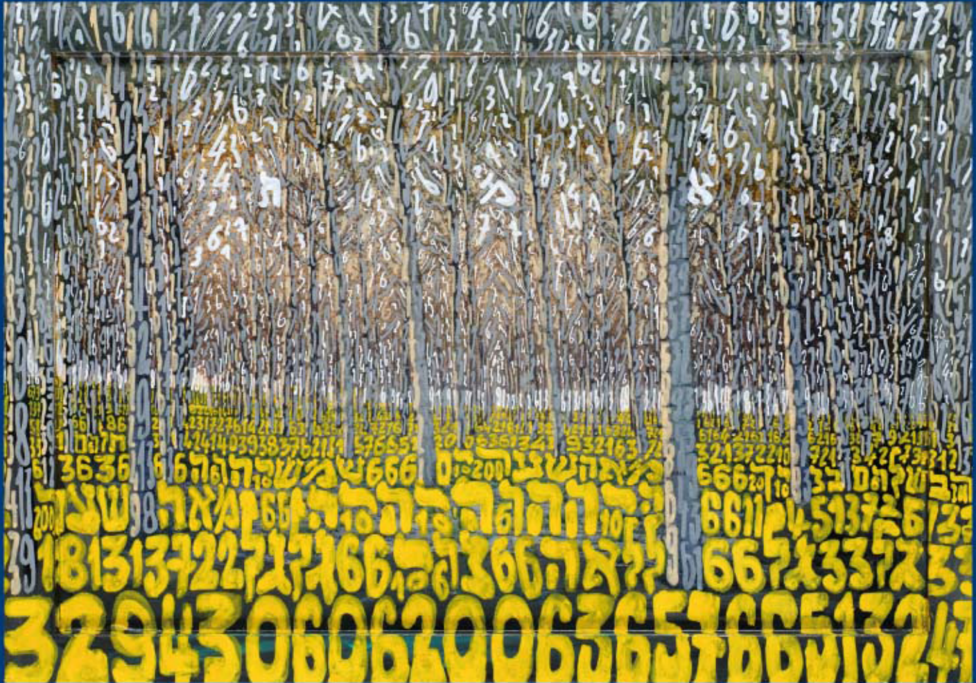
Tobia Ravà 943 Il bosco delle 100 porte. Collezione Kangourou